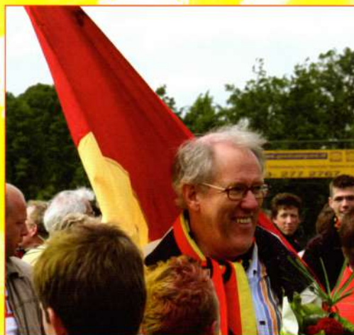
Een blijde voorzitter.

Email info@hofstra-trainingen.nl / www.hofstra-trainingen.nl