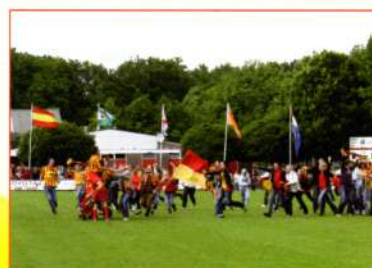
TOGR-GA: . De wedstrijd is beslist de gevolgen zijn hierboven te zien. Wat een ontlasting