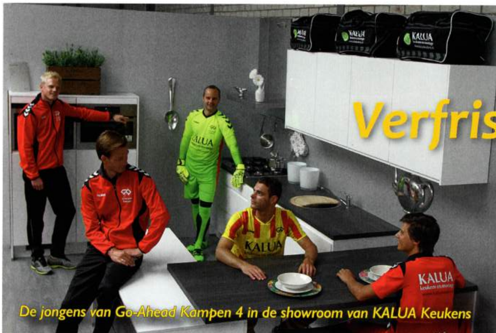
De jongens van Go-Ahead Kampen 4 in de showroom van KALUA Keukens