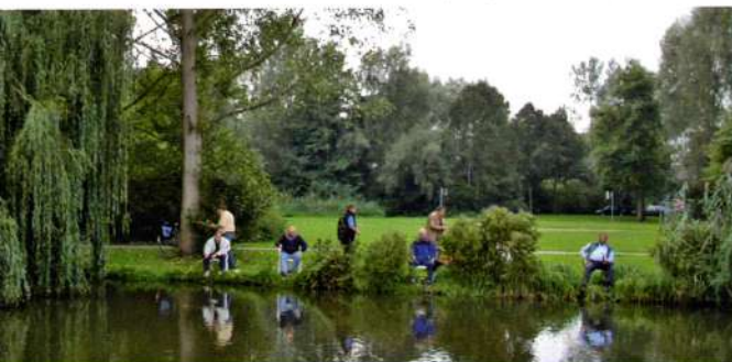
Traditionele jaarlijkse viswedstrijd sponsoren