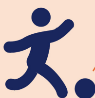
Huidig Schieten of passen