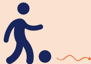
Nieuw Dribbelen, schieten of passen