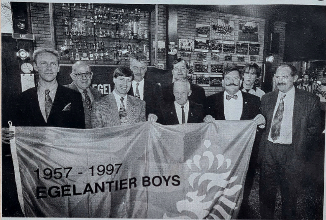
Het bestuur van de jarige Egelantier Boys.