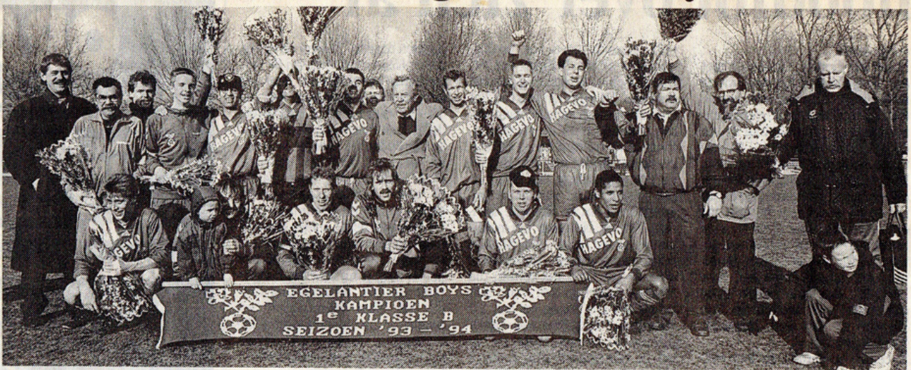
Het elftal van Egelantier Boys.

Rotterdam - Voor het eerst na 34 jaar ging de vlag in top. Dat hebben ze in de omgeving van de Krabbendijkestraat en Charloise Lagedijk ook geweten. Een knallend vuurwerk werd ontstoken nadat Egelantier Boys middels een