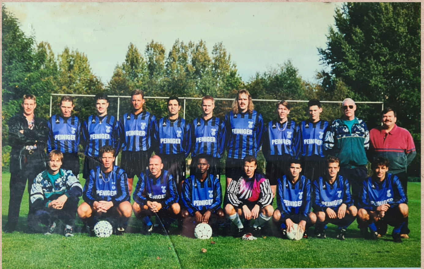
EGELANTIER BOYS seizoen 1995/1996 met dank aan de Fa. Peiniger te Heijningen