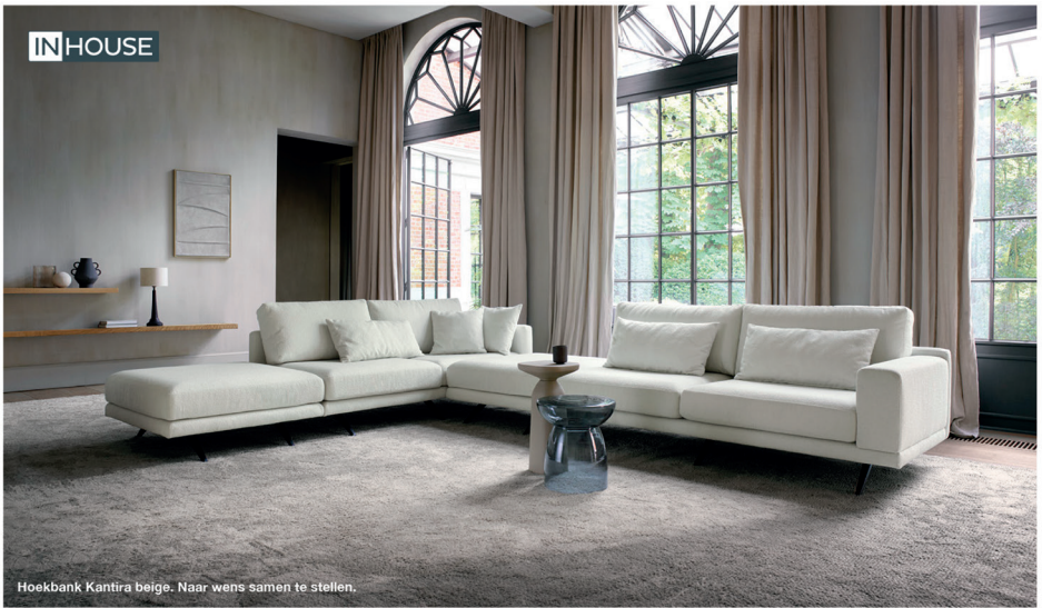
Hoekbank Kantira beige. Naar wens samen te stellen.