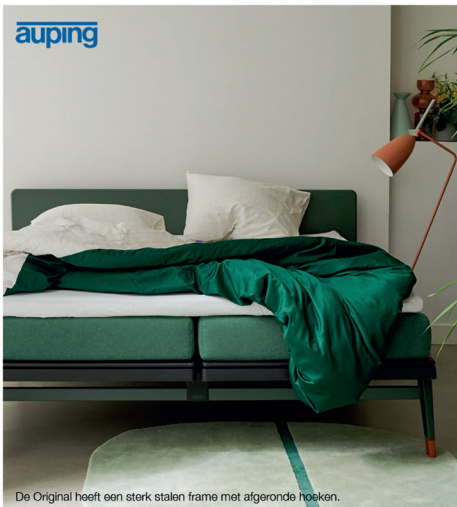
De Original heeft een sterk stalen frame met afgeronde hoeken.