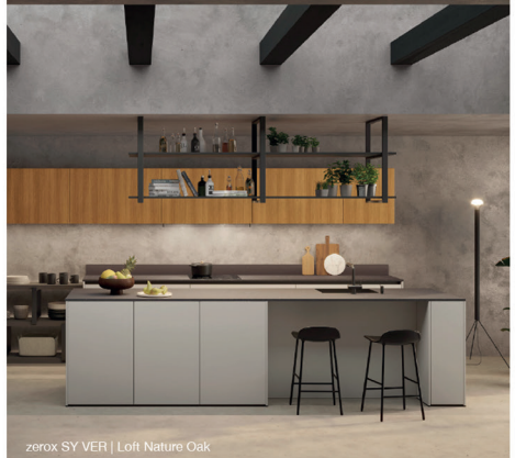
zerox SY VER | Loft Nature Oak