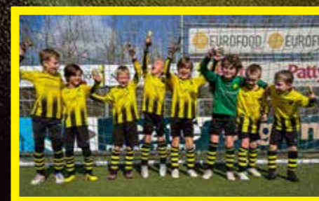
JO8-3 4 e klasse, 3 e fase