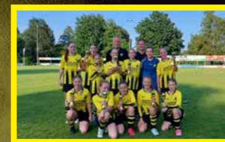
MO13-2 2 e klasse, 2 e en 3 e fase