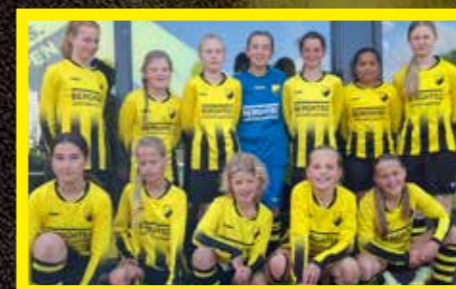
JO14-1 2 e klasse, 3 e fase