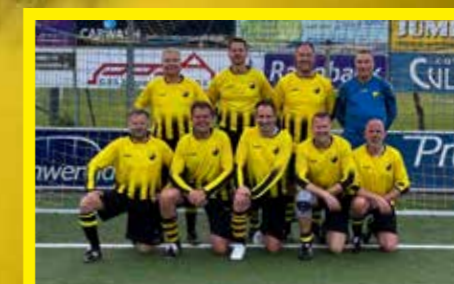
45+2 1 e klasse 03