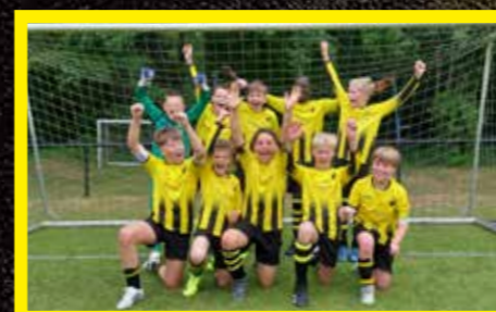
MO11-1 6 e klasse, 4 e fase