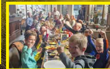
JO10-1 Hoofdklasse, 3 e en 4 e fase