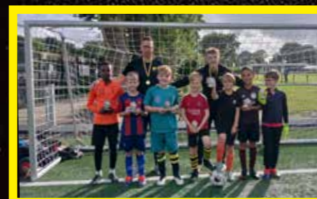
JO10-4 4 e klasse, 4 e fase