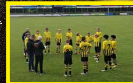
JO13-3 5 e klasse, 3 e fase