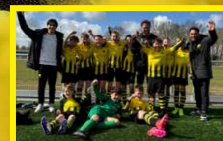
JO12-2 3 e klasse, 3 e fase