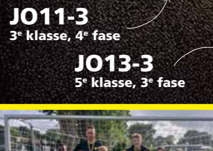
JO11-3 3 e klasse, 4 e fase