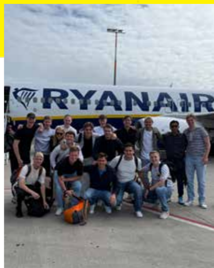
tegenaan. Hopelijk dit keer mét doelpunten.

Al met al: geen prijzenkast erbij dit jaar, maar wél herinneringen om in te lijsten. Volgend seizoen gaan we er weer vol