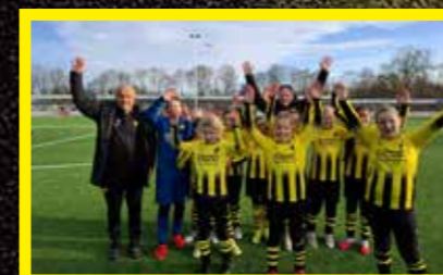
MO11-1 7 e klasse, 1 e fase 5 e klasse, 2 e fase