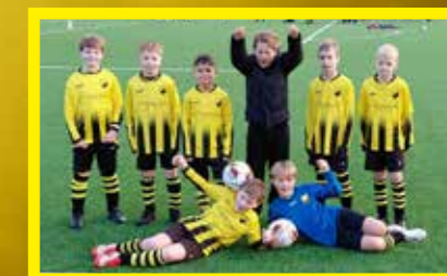
JO10-9 5 e klasse, 2 e fase