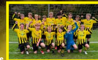
JO15-2 2 e klasse, 1 e fase