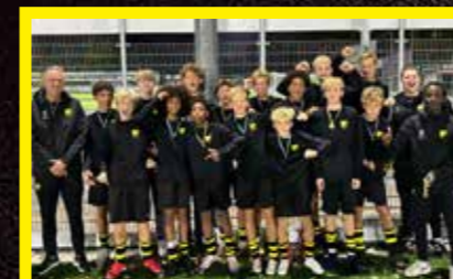
JO15-1 Hoofdklasse, 1 e fase