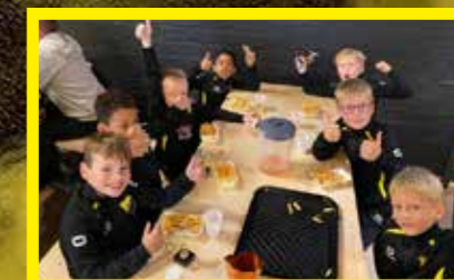
JO9-3 3 e klasse, 1 e fase