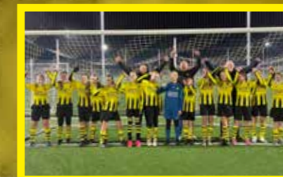
MO13-1 Hoofdklasse, 2 e fase