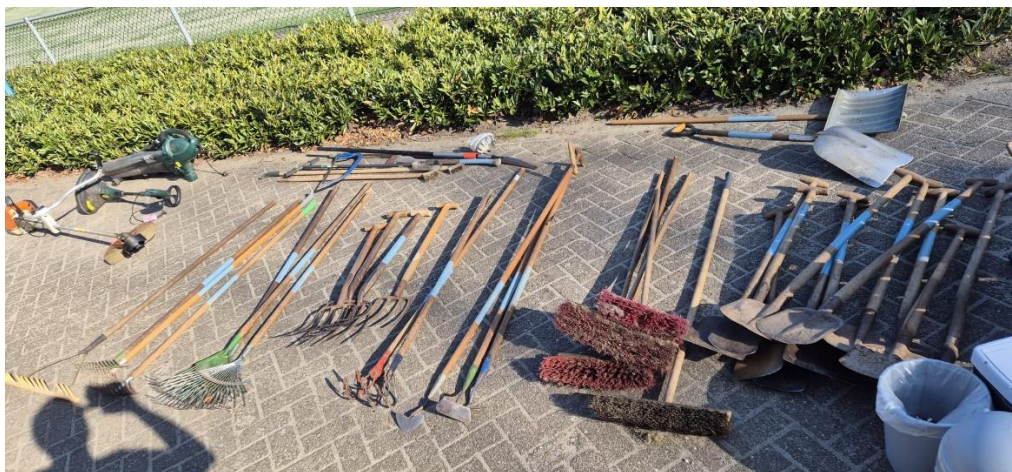
Aan gereedschap voor de groenvoorziening geen gebrek...

Afgelopen 2 zaterdagen hebben we met een kleine maar vaste groep Devinco-leden de grote voorjaars schoonmaak gehouden bij Het Middenvak. En dat was ook weer hard nodig. De kleedkamers ruiken weer fris, je kan weer door de ramen kijken vanuit de kantine, de materialenhokken zijn weer opgeschoond, de reclameborden, dug-outs en scorebord zijn gesopt, het onkruid rondom de velden zijn verwijderd en zelfs het pafdak is schoongemaakt. Kortom, we zijn weer klaar om alle gasten én eigen leden te ontvangen in een schoon en net clubhuis! Aan ons allen om dit ook zoveel mogelijk netjes te houden en de materialen terug te zetten waar je ze ook gepakt hebt. Dus niet ergens anders zodat we niets meer terug kunnen vinden, maar daar waar het hoort.