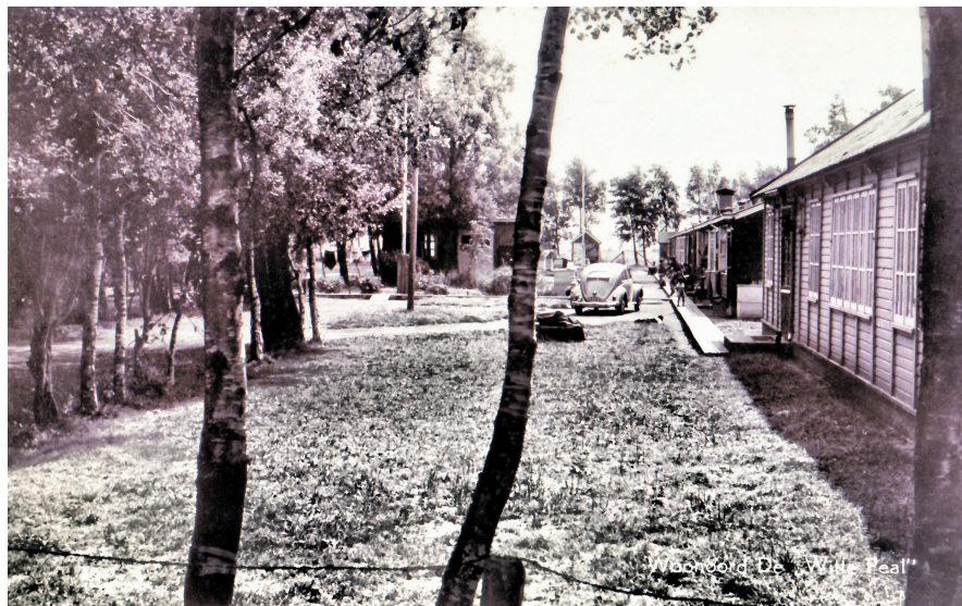
DWP in 1959.