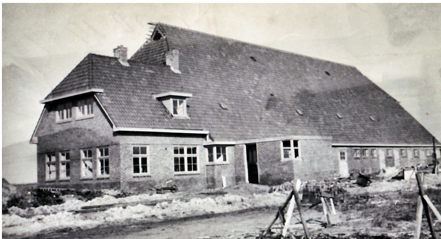
De nieuw gebouwde boerderij van Klaas Eefting.