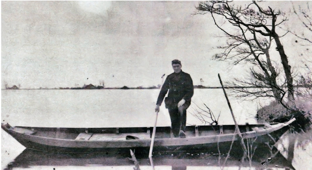
Visser op het Rohelster Wide.

Aanbesteding in de Jouster Courant van 25-07-1940.