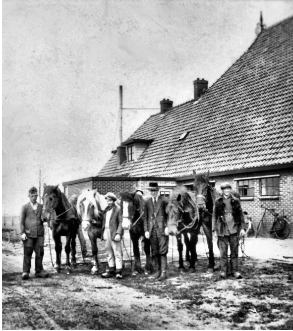
Paarden hielpen toen de boer.