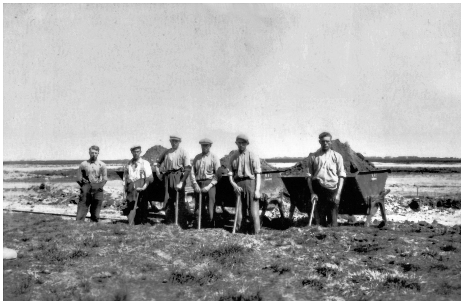
De verveners in actie. Links staat de opzichter Klaas Eefting.