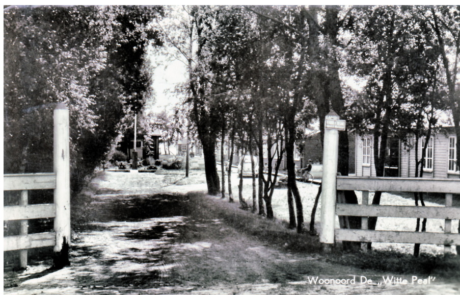
DWP in de bomen met het bordje 'verboden toegang'.