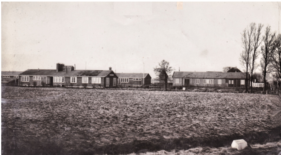
Het kamp 'De Wite Peal' in ongeveer 1941.