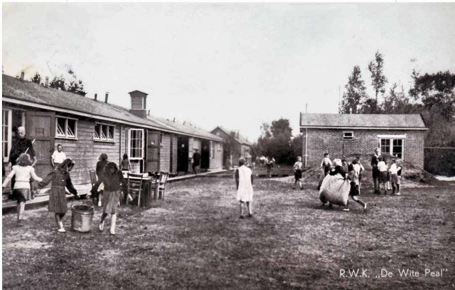
Onder en boven: DWP als vakantiecamp na 1945/46.