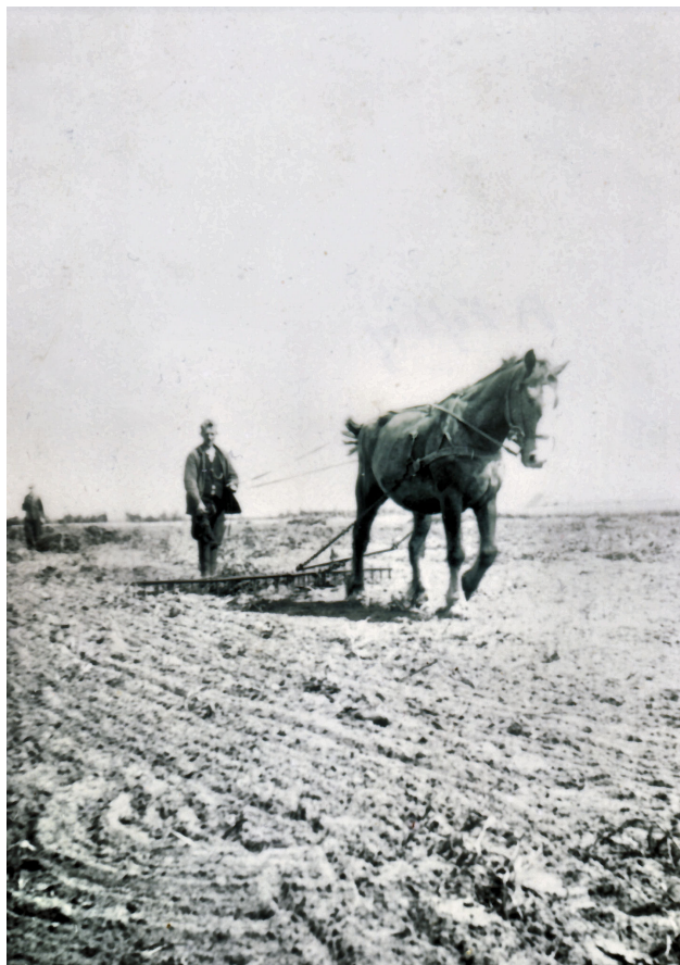
Ploegen op de akkers van boer Eefing.