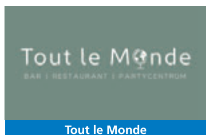
Tout le Monde