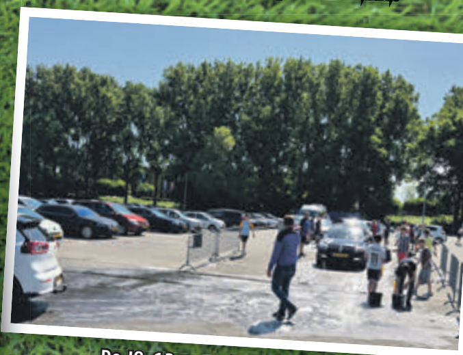
De J0-13 organiseerde een 'carwash' voor het goede doel.