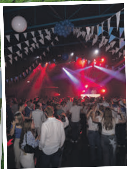
Het jaarlijkse grote DSVP-feest had dit jaar als thema Sensation White & Blue, naar de clubkleuren.