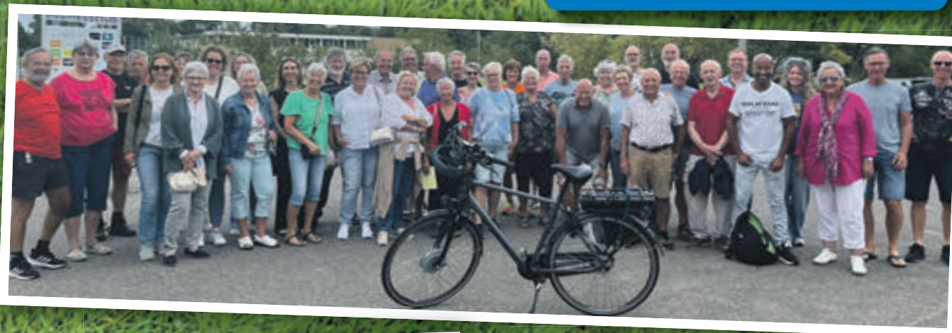
Het seizoen sluiten DSVP-vrijwilligers traditiegetrouw af met een mooie fietstocht, plus barbecue.