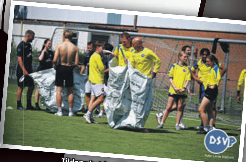
Tijdens het jaarlijkse onderling toernooi gaat het niet alleen om voetbalkwaliteiten.