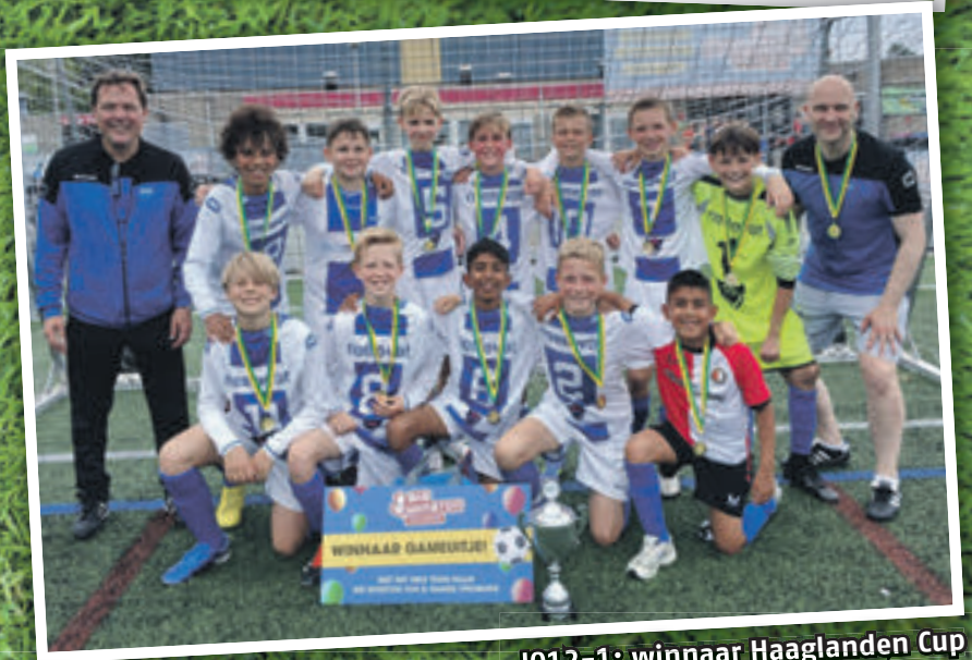
J012-1: winnaar Haaglanden Cup