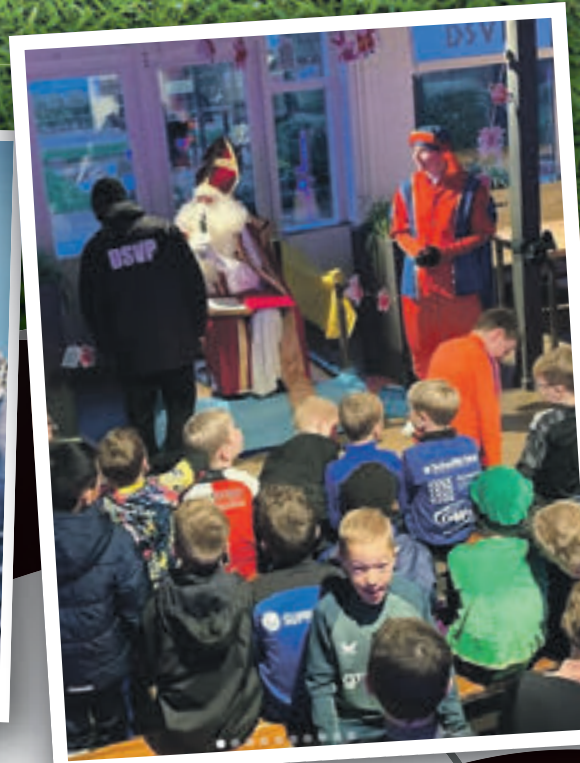
Nog meer hoog bezoek; ook de Goedheiligman wist ondanks alle drukte toch nog tijd vrij te maken voor DSVP.