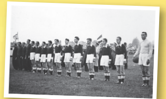
DSVP luistert naar het volkslied