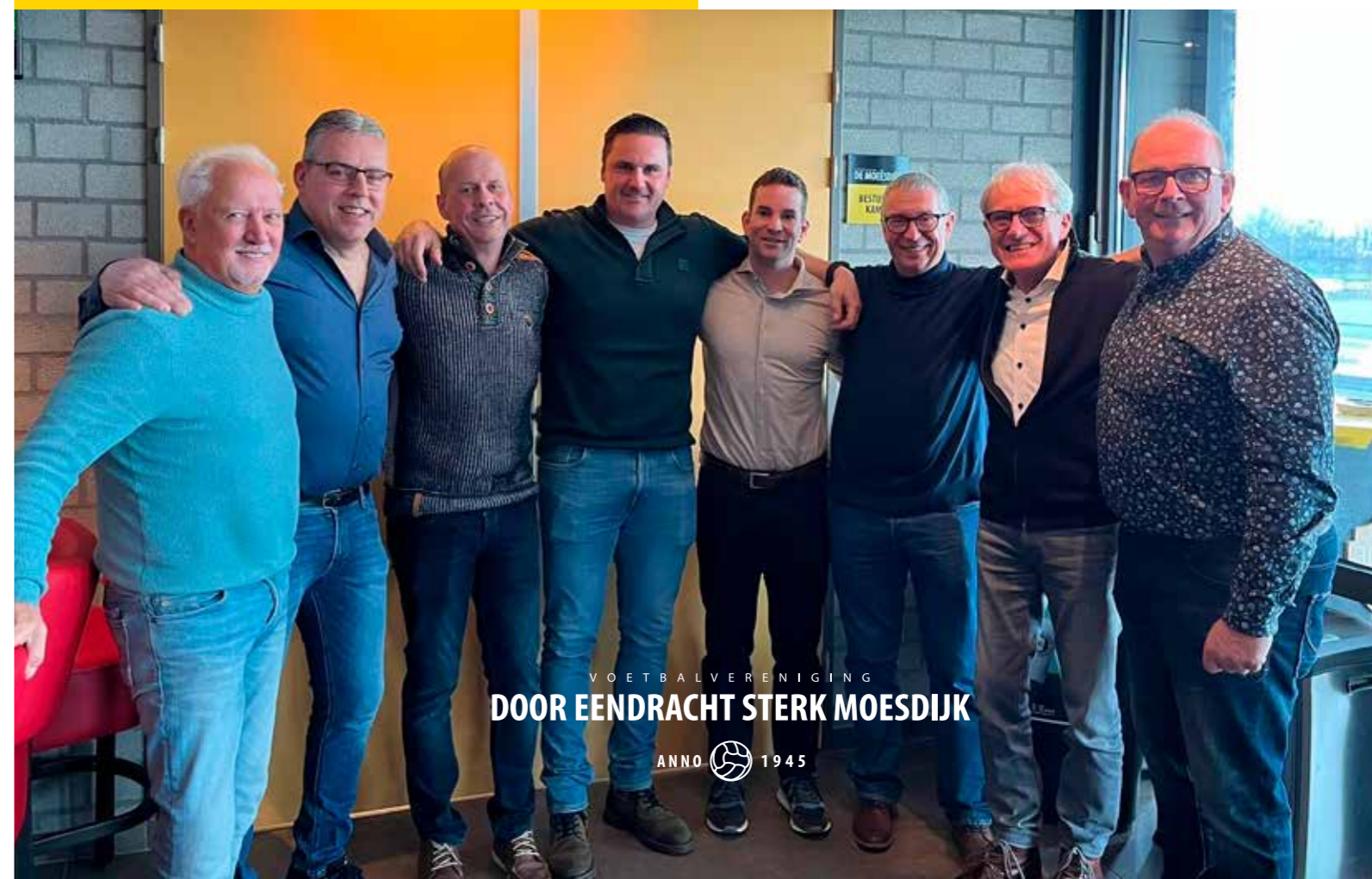
VOETBALVERENIGING DOOR EENDRACHT STERK MOESDIJK ANNO 1945