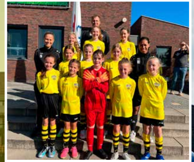
VV DESM J011-3