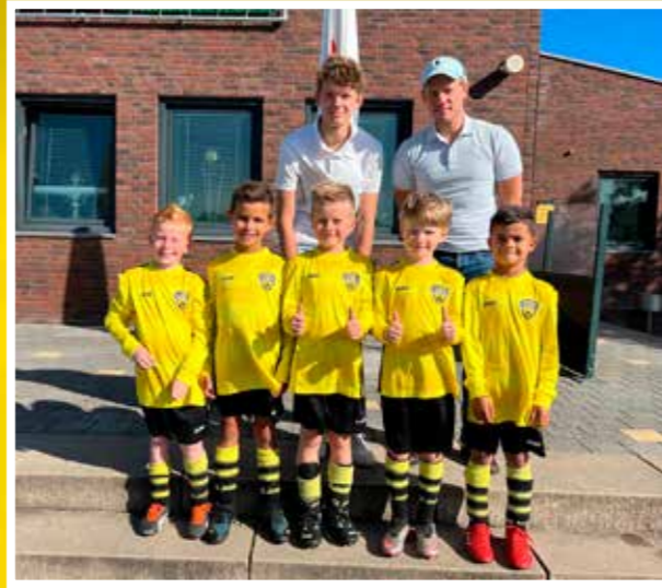
VV DESM J08-1