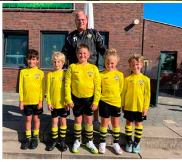
VV DESM J09-3