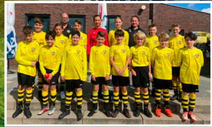
VV DESM J013-2