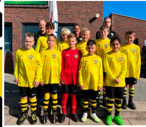
VV DESM J011-2