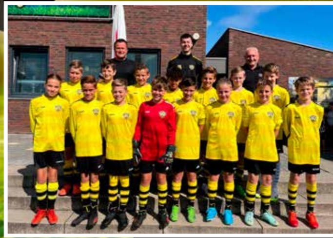
VV DESM J013-1