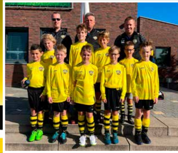
VV DESM J010-2