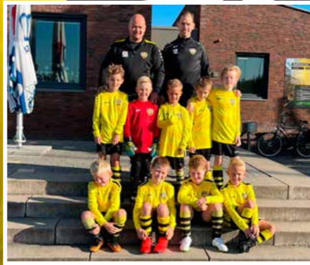
VV DESM J09-2