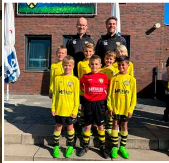
VV DESM J09-1