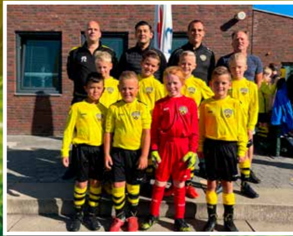
VV DESM J010-1