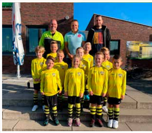
VV DESM MINI'S