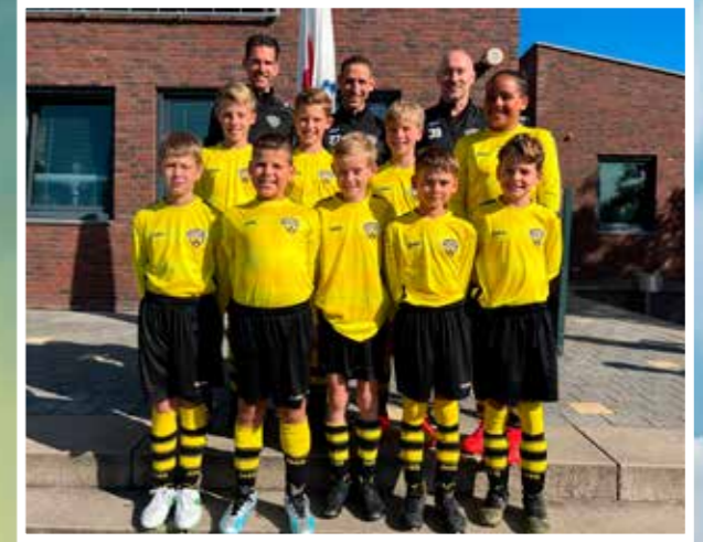
VV DESM J011-1