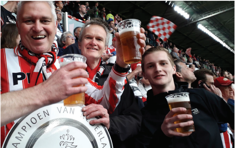
PSV in betere tijden.