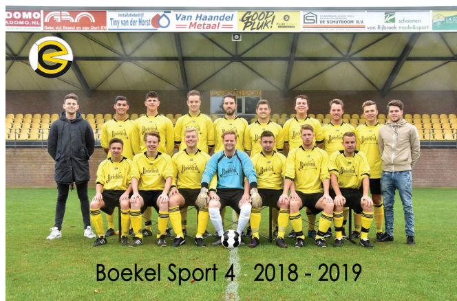
Boekel Sport 4 2018 - 2019