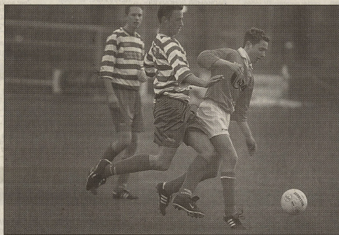
▲ Bekkerveld holt achter de feiten aan en moet zelfs de noodrem hanteren. Weltania verdedigde drie kostbare punten in de strijd tegen degradatie.