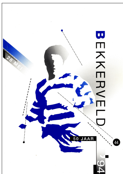
Voorpagina Jubileumboek (Voor de inhoud zie 10-03-50 jaar-Jubileumuitgave)

Het belangrijkste feit in het seizoen 1993-1994 was de voorbereiding en de viering van het 50-jarig bestaan van RKSv Bekkerveld. Het jubileumfeest werd op 27 en 28 mei gehouden. In dit kader werden o.a. een jubileumboek (zie 10-03-50 jaar-Jubileumuitgave) en jubileum-verjaardagskalender uitgegeven. Voor verdere informatie over dit feest wordt verwezen naar het document '10-03-50 jaar'.