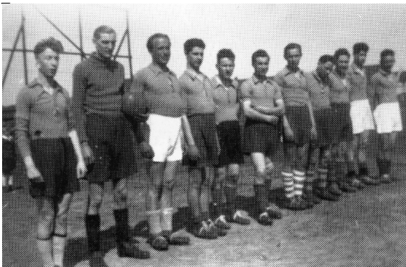
De bovenstaande foto is ontleend aan het jubileumboek 'Bekkerveld 50 jaar' (Zie 10-03-50 jaar-Jubileumuitgave). Men spreekt van een kiekje van een glorie-elftal uit de beginjaren. Getuige de spelers op deze foto, betreft de foto vermoedelijk het 1 e elftal aan het begin van het seizoen 1946-1947.

AFDELING: 2 e klasse G 'afdeeling' Limburg KNVB; EINDSTAND: 1 e plaats.