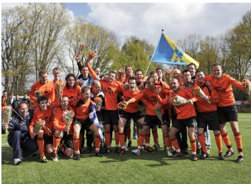
De kampioenen van 2012.