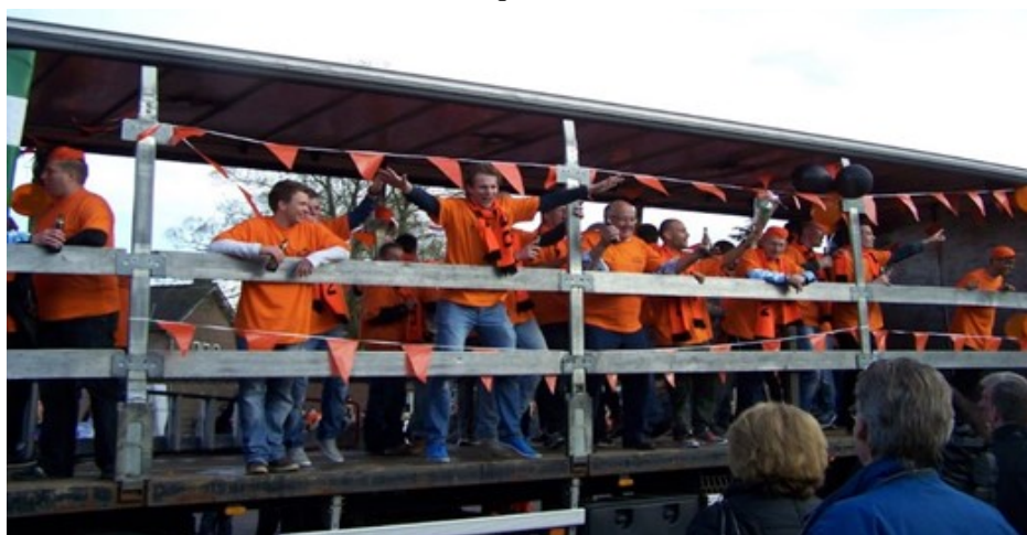
Op de platte kar.