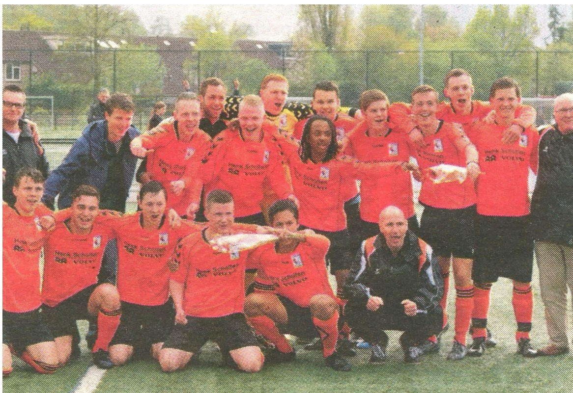
Kampioenselftal A1 met trainer en leiders.

Op 12 september 2016 werd de club geconfronteerd met het overlijden van oud-