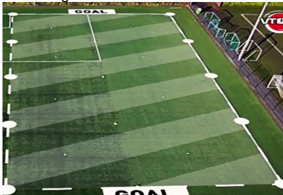
Afb. 5 partijspel