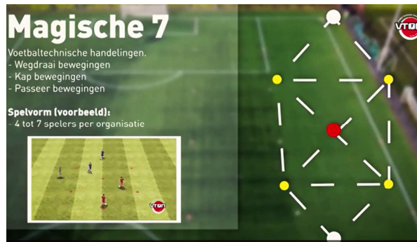
Afb.4 Magic 7