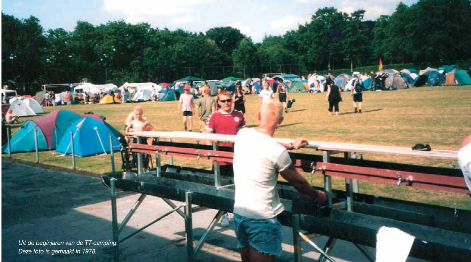
Uit de beginjaren van de TT-camping. Deze foto is gemaakt in 1978.

open zolang er mensen zijn. En gehaktballen en uitsmijters zijn de hele dag verkrijgbaar. Er is een vaste camping-gast die iedere avond, na zijn bezoek aan de Asser kroegen, nog een gehaktballetje bij ACV bestelt."